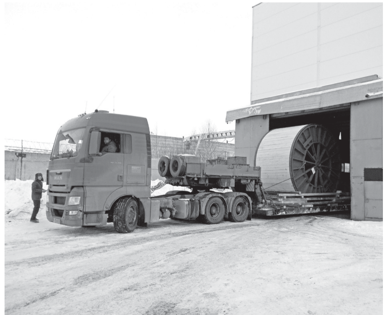
Тралы берут курс на Волгоград